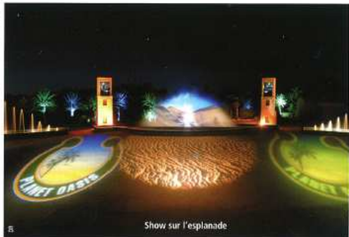
Show sur l'esplanade

gradins (800 p.) accueille les star diners et peut être utilisée pour un lancement de produits, un concert ou un spectacle (régie son et images, mur d'eau sur fond de palmeraie pour projection d'images géantes...). Le site offre également une palmeraie de 1,5 ha pour déjeuners et dîners à thème sous tente ou sous dais ainsi qu'un espace dégagé pour l'héliport, utilisable en team building, animations sportives, ateliers ou autre stands d'expo et un confortable village de tentes bédouines va voir le jour prochainement dans une extension de la palmeraie... sinon Planet Oasis propose un hébergement dans une sélection d'hôtels de Tozeur, le Sofi-