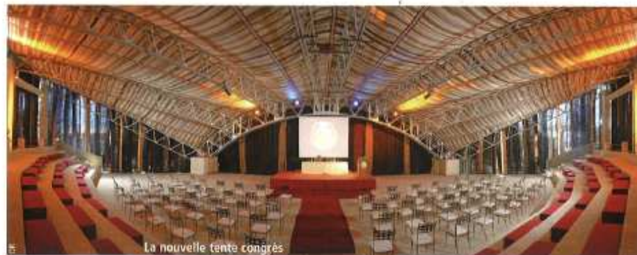
La nouvelle tente congrès